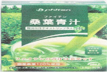
難消化性デキストリンプラス